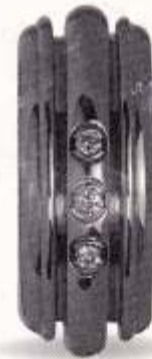
in de ring