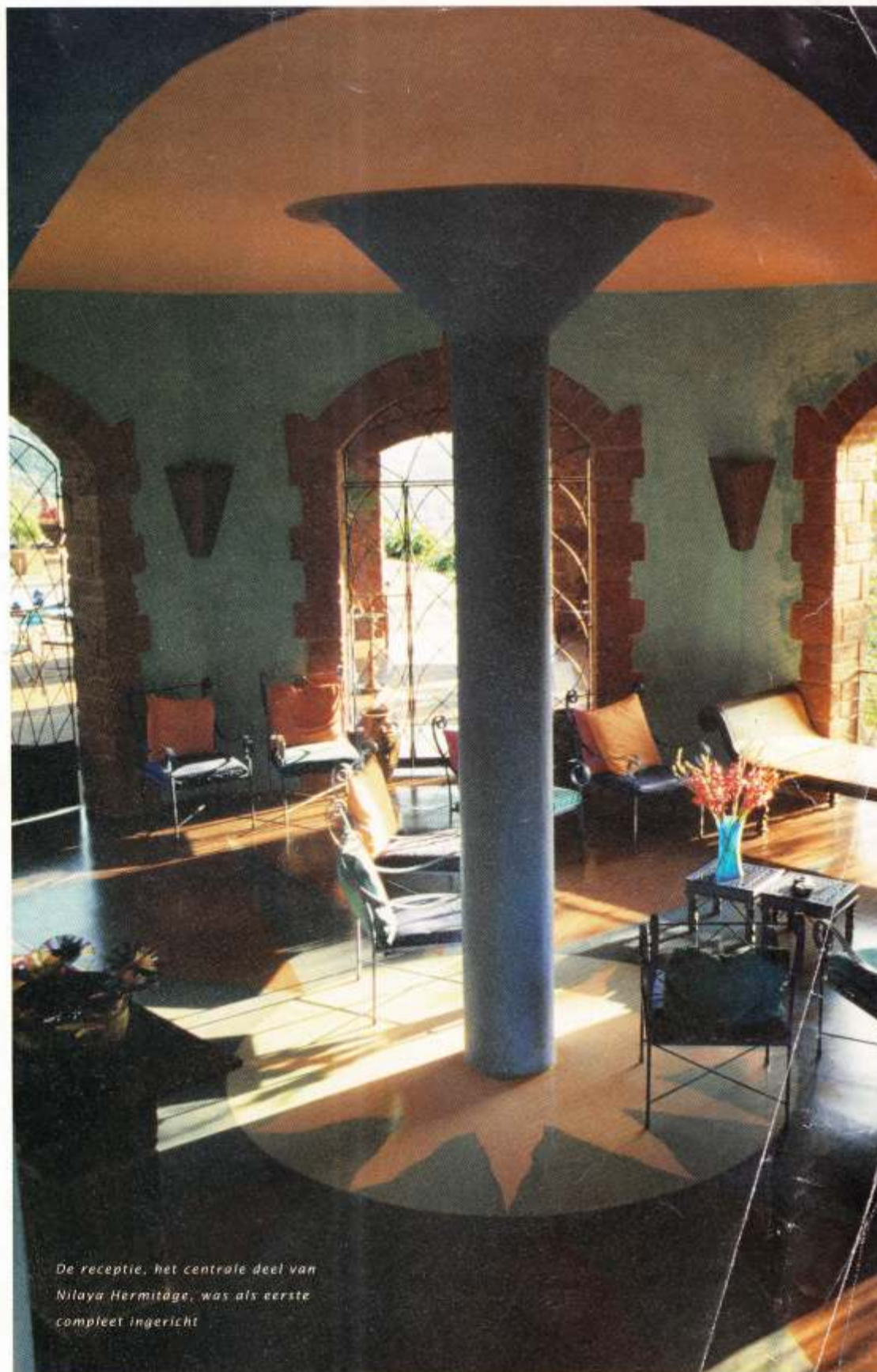
De receptie, het centrale deel van Nilaya Hermitage, was als eerste compleet ingericht

DE SIERLIJK GRILLIGE BOUW VAN NILAYA VOLGT DE RONDINGEN VAN EEN AZUURBLAUW ZWEMBAD MET DE AFMETINGEN VAN EEN KLEIN MEERTJE